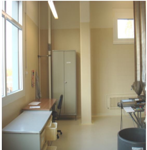
Fabrikationsbetrieb / atelier de fabrication