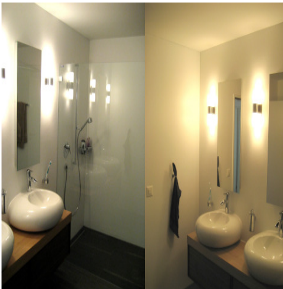
Badezimmer / salle de bains