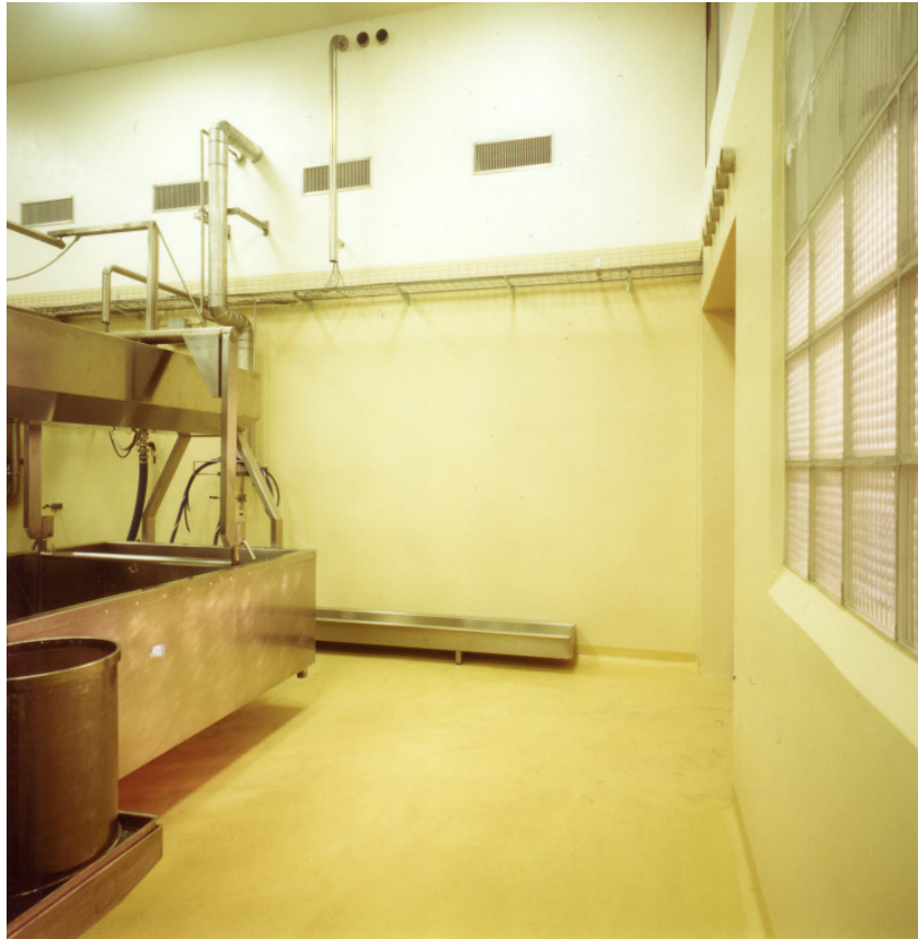
Molkerei / laitterie