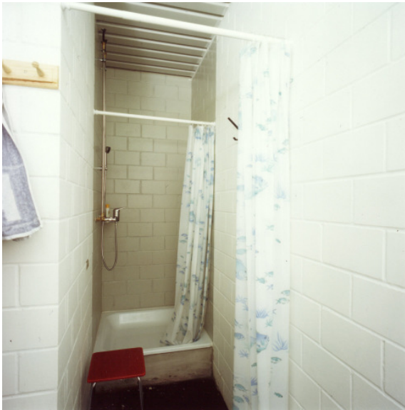
Nasszone / douche