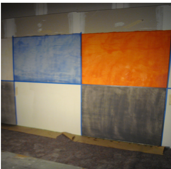
auch lasierend möglich / également possible azuré