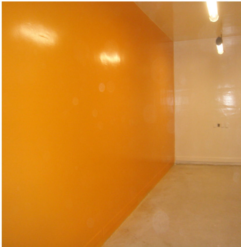
Labor / laboratories