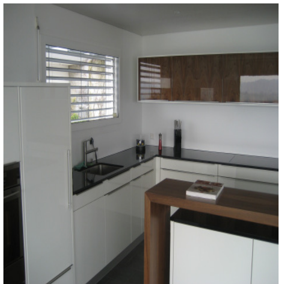
Küche / cuisine